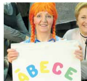
niem sniegto sirsnību un mīlestību! ✘

Liels paldies visiem dārziņa darbiniekiem par nesavtīgo palīdzību izrādes tapšanā, paldies, ka uzņēmāties jums uzticētās lomas, paldies, ka atradāt laiku, lai nāktu uz mēģinājumiem, paldies par bēr-