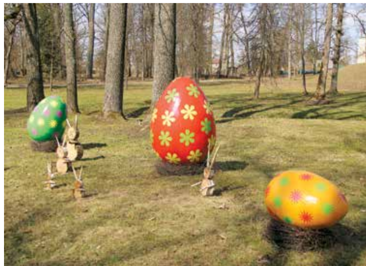
Lieldienu dekori Rembates parkā Lielvārdē.