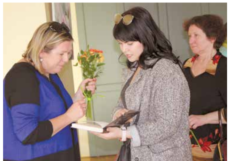
Pasākuma dalībnieki ne tikai izmantoja iespēju personīgi aprunāties ar rakstnieci Noru Ikstenu (no kreisās), bet arī lūdza viņas autogrāfu.

Kad Nora Ikstena deva saviem klausītājiem iespēju uzdot viņiem jautājumus, to vietā rakstniece saņēma pateicības vārdus, atklātus stāstus un apliecinājumus tam, ka cilvēkiem viņas grāmatas sižets