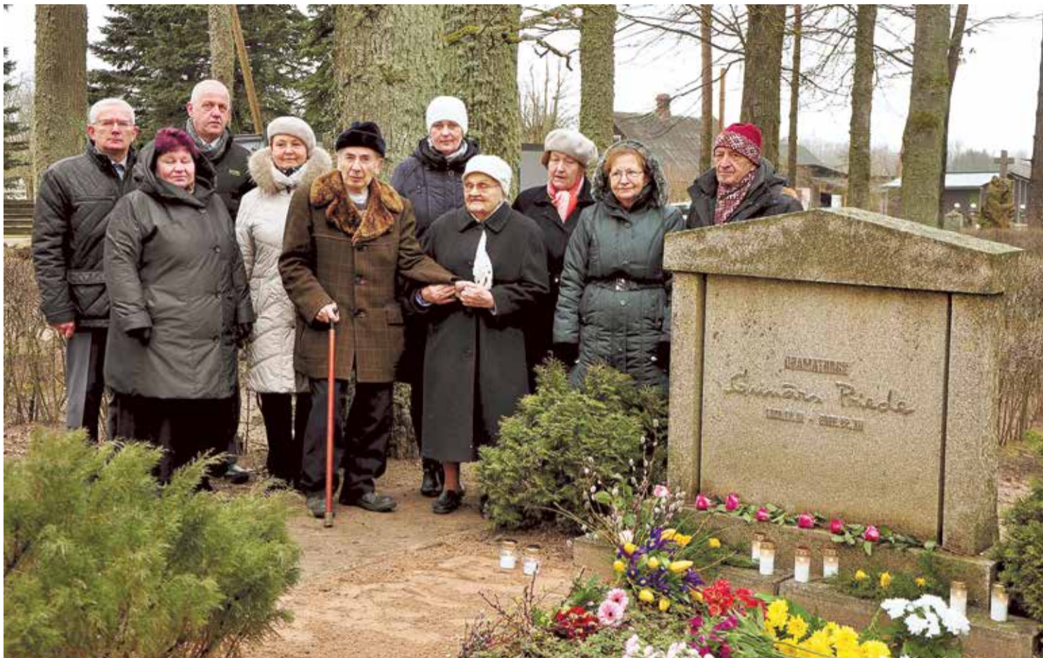
Piemīņas brīdis kapsētā.