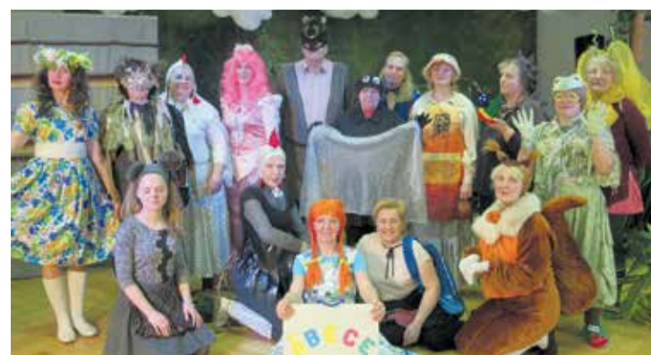
Pēc pasakas izrādes.