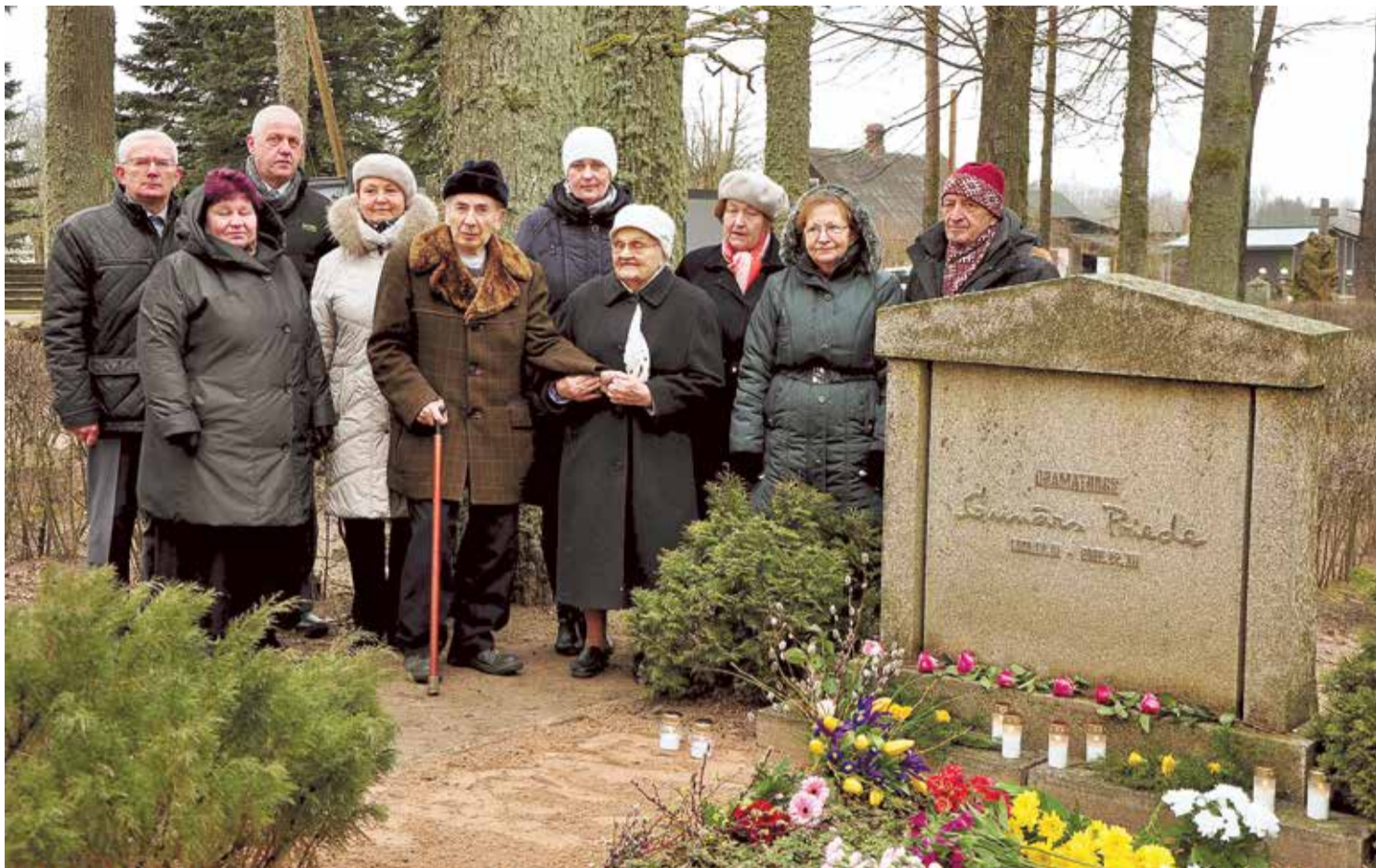
Piemiņas brīdis kapsētā.