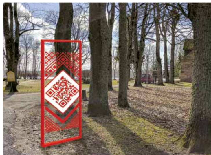
Attēlam ir ilustratīvs raksturs.

Tradicionālajā Lielvārdes jostā ieaustais vērtējums ir atšifrējams vien tad, ja ir zināšanas par tās rakstā iekļauto zīmju simbolisko nozīmi. Šis zināšanas tālāk tika nodotas mutvārdu ceļā, bet mūsdienās par galveno informācijas iegūšanas avotu ir kļuvis tīmeklis, un piekļūšanu tam nodrošina dažādas iekārtas. Viedzīmes jostas raksts ir veidots no QR kodiem (Quick Response code) un no tiem atvasinātiem elementiem. QR kodos ieprogramētajai informācijai ir viegli piekļūt. To var izdarīt ar jebkuru mobilo iekārtu, kam ir interneta pieslēgums un mobilā lietotne QR kodu lasīšanai.