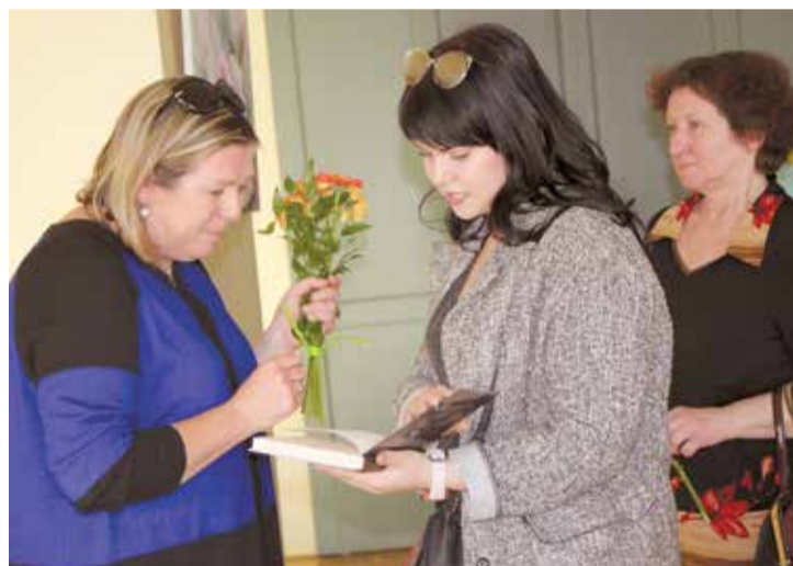
Pasākuma dalībnieki ne tikai izmantoja iespēju personīgi aprunāties ar rakstnieci Noru Ikstenu (no kreisās), bet arī lūdza viņas autogrāfu.

Kad Nora Ikstena deva saviem klausītājiem iespēju uzdot viņiem jautājumus, to vietā rakstniece saņēma pateicības vārdus, atklātus stāstus un apliecinājumus tam, ka cilvēkiem viņas grāmatas sižets