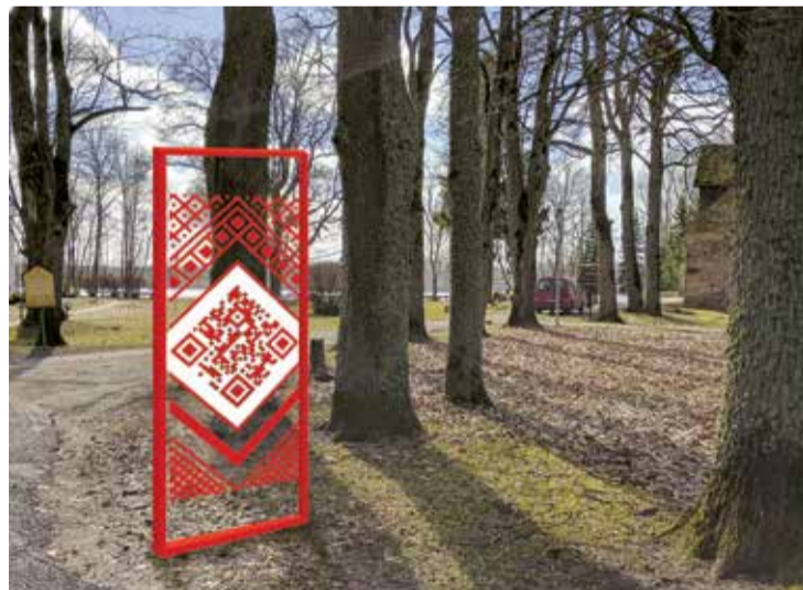
Attēlam ir ilustratīvs raksturs.

Tradicionālajā Lielvārdes jostā ieaustais vērtējums ir atšifrējams vien tad, ja ir zināšanas par tās rakstā iekļauto zīmju simbolisko nozīmi. Šis zināšanas tālāk tika nodotas mutvārdu ceļā, bet mūsdienās par galveno informācijas iegūšanas avotu ir kļuvis tīmeklis, un piekļūšanu tam nodrošina dažādas iekārtas. Viedzīmes jostas raksts ir veidots no QR kodiem (Quick Response code) un no tiem atvasinātiem elementiem. QR kodos ieprogramētajai informācijai ir viegli piekļūt. To var izdarīt ar jebkuru mobilo iekārtu, kam ir interneta pieslēgums un mobilā lietotne QR kodu lasīšanai.