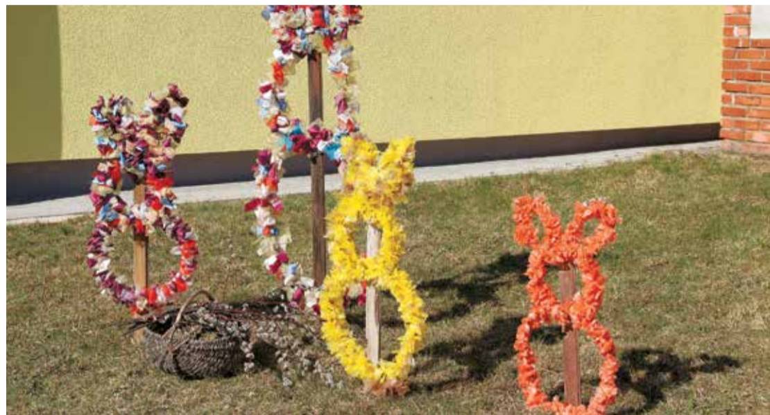
Lentišu zaķi pie bērnu dārza „Zvaniņš” Jumpravā.