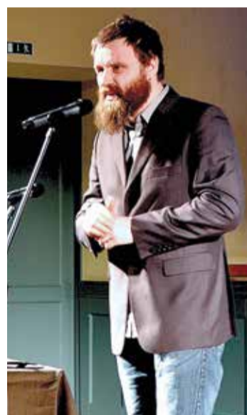
Režisors Mārtiņš Eihe.