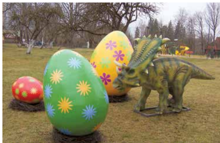
Lēdmanē arī dinosaurs no jaunā atpūtas un atrakciju parka.