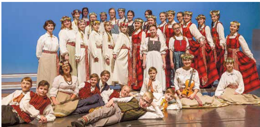
Somijā pēc izrādes.

Pēc piecu dienu intensīva un interesanta darba sekoja pirmā kopīgā uzstāšanās, rādot izveidoto mūziklu plašākai publikai vienā no Reikjavīkas baznīcām. Paralēli darbam mēs baudījām arī skaistos un vienreizīgos Islāndes dabas brīnumus – peldi Zilajā lagūnā, geizerus un vienu no lielākajiem šīs salas ūdenskritumiem. Daba šeit ir bezgala skaista un neapprakstāmi gleznaina, bet arī skarba. Laikapstākļi mūs šoreiz nelutināja, bet bijām tam gatavi. Apmeklējām arī Reikjavīkas koncertzāli „Harpa”, kur ļāvāmies klasiskās mūzikas valdzinājumam, bet noslēguma vakarā klausījāmies vienu no slavenākajiem seno instrumentu orķestriem lielākajā Islāndes baznīcā “Hallgrímskirkja”.