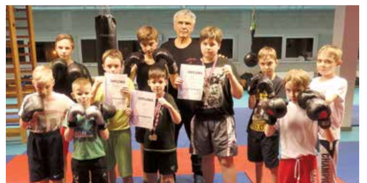
Lielvārdes bokseru komanda pēc sacensībām Olainē.

Nobeigumā par to, kāpēc vispār cilvēki nodarbojas ar boksu? Iespējami vairāki iemesli. Pirmais iemesls varētu būt fiziskas slodzes nepieciešamība. Otrais – sasniegt kaut ko vairāk par vienkāršu patrenēšanos. Skaidrs, ka to var panākt pamazām, pareizi organizējot nodarbību, pareizi izpildot vingrinājumus. Boksa nodarbībās attīsta drosmi, aukstasinību, apķērību, izturību. Neatņemams boksa cīņas elements ir ātrums, kas nepieciešams gan uzbrūkot, gan aizsargāties, jo visa darbība notiek ļoti strauji. Pakāpeniski palielinot slodzi, tiek attīstīta sirds muskulatūra.