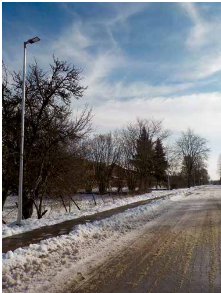
Vidus ielā ierīkots moderns LED apgaismojums, kas ir pirmais solis Jumpravas apgaismojuma tīkla renovācijā.

Savu pagastu mēs varēsim „pacelt” tikai tad, ja dzīvosim šeit, darīsim savu darbu un meklēsim attīstības iespējas.