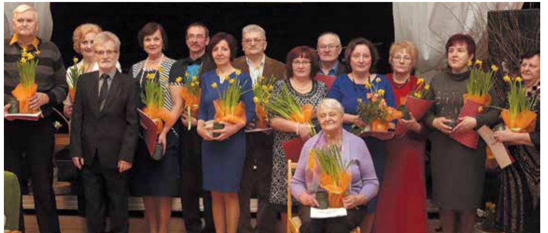
Jumpravas kultūras nama jubilejas svinībās.

Svētku pasākuma svinīgajā daļā teicām lielu paldies visiem kultūras dzīves veidotājiem – kultūras dzīves vadītājiem, amatierkolektīvu vadītājiem, ilggadējiem pašdarbniekiem un kultūras dzīves atbalstītājiem, kas gadu no gada sniedz