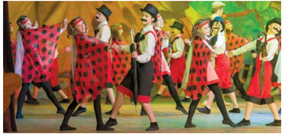
"Circenis Frīdis un viņa piedzīvojumi" – košo mārišu dejas.