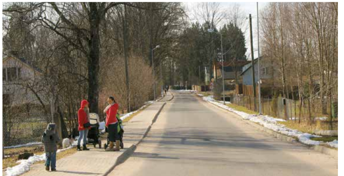
Lauku iela Lielvārdē.