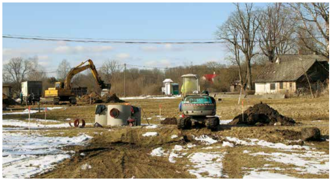
Te, kur šobrīd notiek rakšanas darbi, būs jaunā gājēju iela.

Būvprojekta īstenošanas rezultātā Lielvārdes centrā būs brūgēts Lāčplēša laukums un divas gājēju ielas: paralēli Lāčplēša ielai no Skolas ielas līdz Ausekļa ielai un no autobusu pieturas līdz Cīruļu ielai. Ielu un laukuma bruģa zīmējumā tiks iestrādāti Lielvārdes jostas raksti. Ielas un laukums iecerēti kā labiekārtoti pilsētvides elementi ar apgaismojumu un labiekārtotām atpūtas vietām. Kopējā līguma summa ir 171991,99 eiro, līguma izpildes termiņš – 2017. gada 30. augusts, būvdarbus veic SIA „Asfaltbūve”.