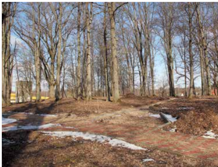
Šeit, Rembates parkā tiks uzstādīts “Goda krēsls” Arvedam un Verai Paeglēm.

Arveds Paegle (2018. gadā – 110. jubileja) un Vera Paegle (2017. gadā – 100. jubileja) ir Latvijā pazīstami Lielvārdes jostu audēji – Tautas daiļ-