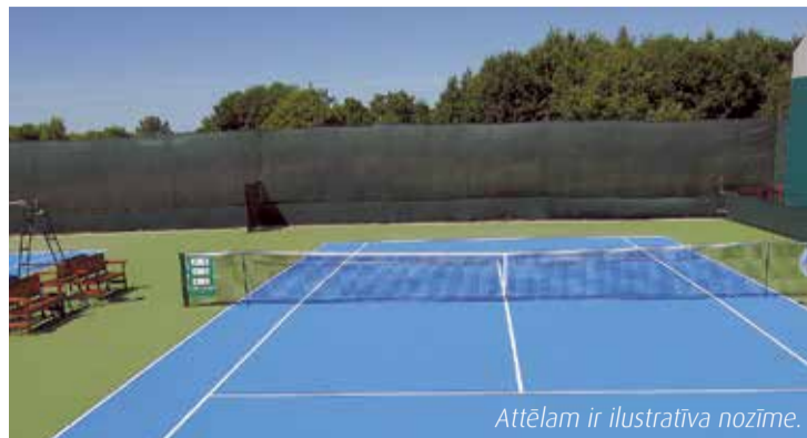
Attēlam ir ilustratīva nozīme.

Seguma ieklāšanas darbi tiks veikti projekta „Multifunkcionāla laukuma izveide Lielvārdē” (projekta Nr. 16-04-AL025-A019.2202-000017) ietvaros.