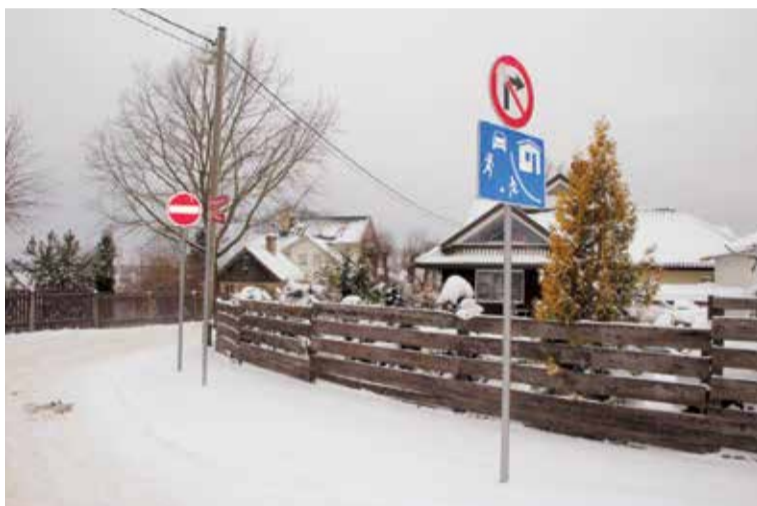
Posmā no Upes ielas 5 līdz krustojumam ar Slimnīcas ielu ir ierīkota vienvirziena satiksme un dzīvojamās zonas ierobežojums.