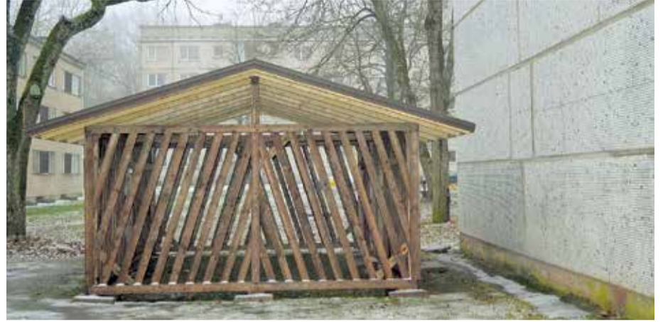
Projekta ietvaros izveidotā veļas žāvētava starp E. Kauliņa alejas 11. un 13. māju.