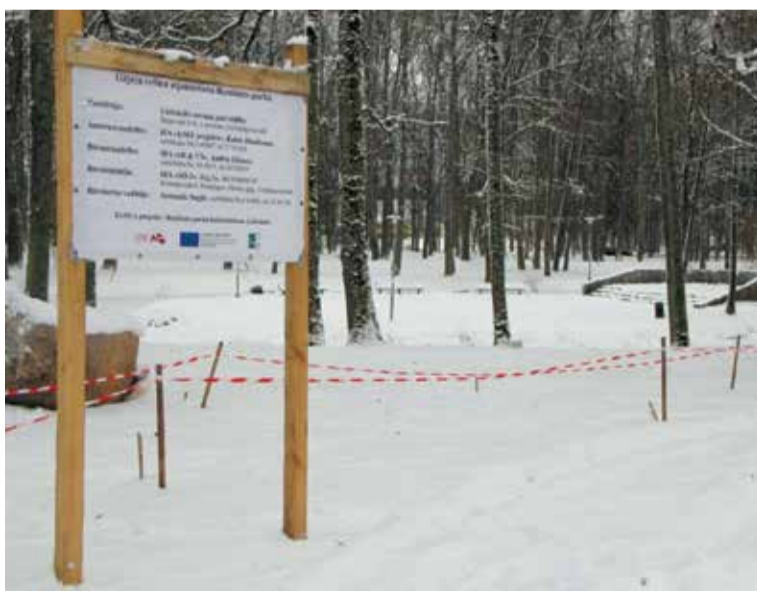
Pastaigu celiņu atjaunošanas darbus Rembates parkā turpinās pavasarī. Iedzīvotāji tiek aicināti ar izpratni izturēties pret ierobežojumiem un pa nepabeigtajiem celiņiem nepārvietoties.

Projektu „Rembates parka labiekārtošana Lielvārdē” (projekta Nr. 16-04-AL02-A019.2201-000006) līdzfinansē Eiropas Lauksaimniecības fonda lauku attīstībai, atbalsta Zemkopības ministrija, Lauku atbalsta dienests un Publisko un privāto partnerattiecību biedrība „Zied zeme”.