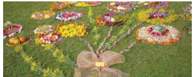
"Zvaniņa" iemītnieku darinātais ziedu paklājs.