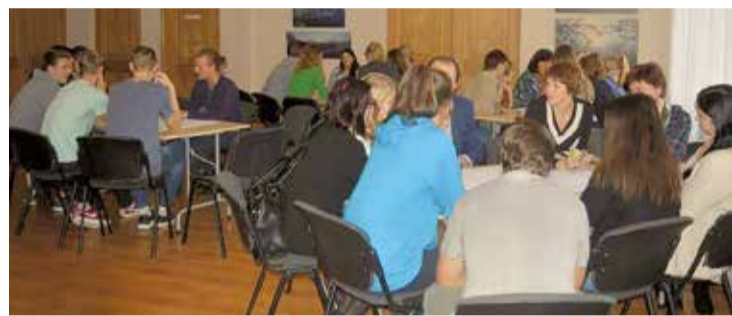
Jauniešu tikšanās ar novada politiķiem un pašvaldības darbiniekiem.

Diskusiju daļā tikšanās dalībnieki kopīgi meklēja atbildes uz dažādiem jautājumiem četrās nozarēs: sportā, kultūrā, izglītībā un politikā un vides aktualitātēs. Svarīgākie jautājumi bija: kas jādara, lai mūsu novads būtu labāks? Kā motivēt jauniešus nebūt vienaldzīgiem, bet