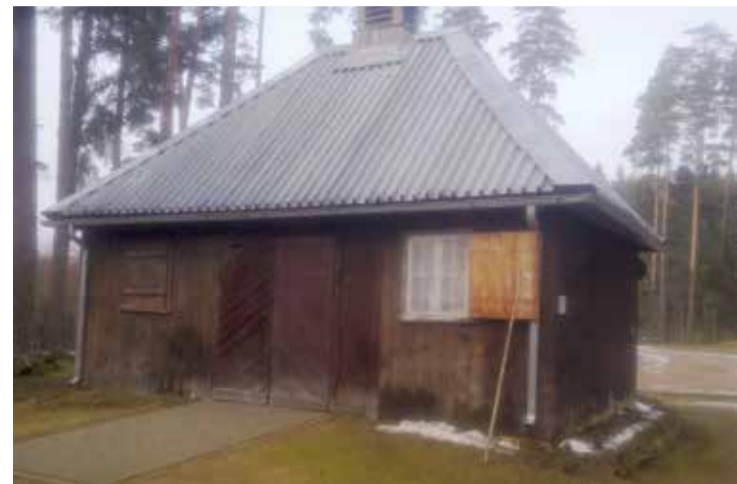
Senā koka būve, kas gadu desmitiem pildīja kapličas funkcijas.