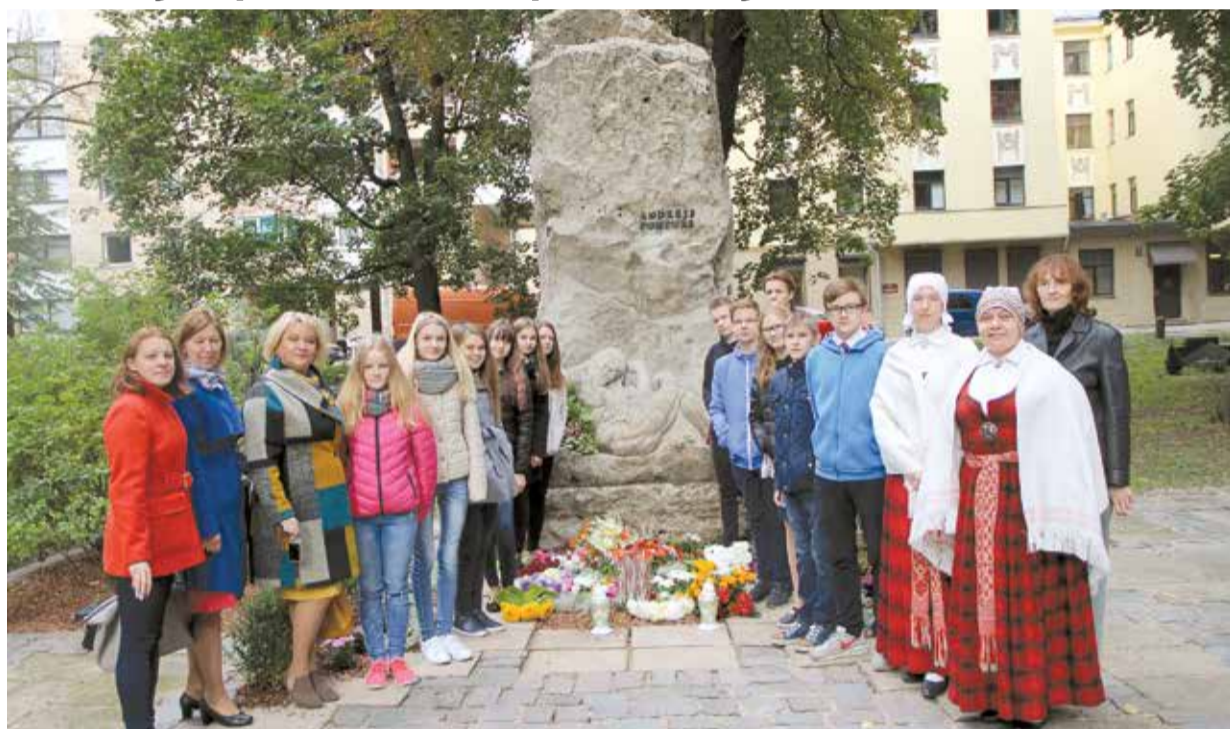
Muzeja darbinieces un citi interesenti pie Andreja Pumpura piemiņas vietas Rīgā.

22. septembrī dīzenajam dzejniekam Andrejam Pumpuram apritēju 175 gadi. Lai godinātu un pieminētu dzejnieku, šajā dienā notika vairāki jubilejai veltīti svētku pasākumi.