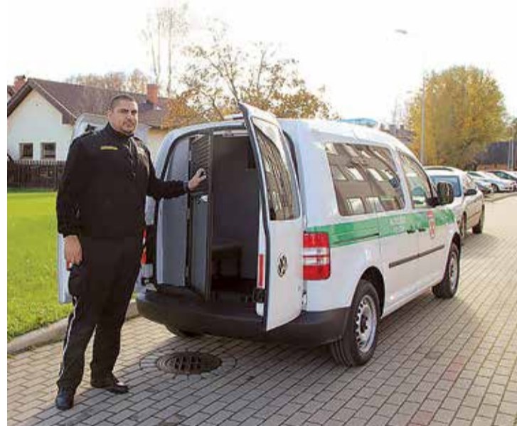
Lielvārdes novada pašvaldības policijā strādā seši darbinieki, kuru uzdevums ir rūpēties par drošību un kārtību novadā.

Manā pakļautībā ir tikai seši darbinieki, kuri strādā mai-