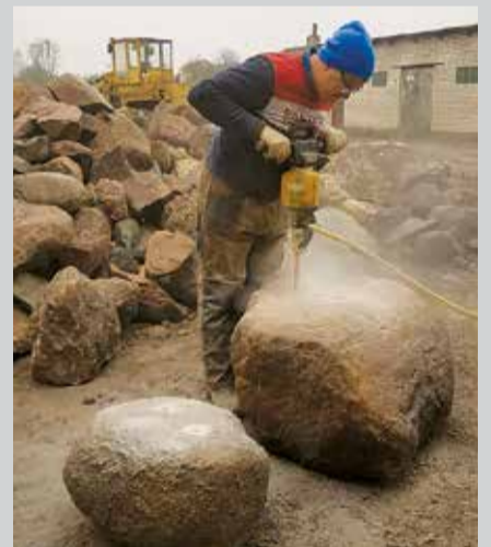
Akmens urbšana ar gaisa urbi, kuru darbina skrūves tipa kompresors.

Savukārt šogad tika realizēts projekts ar Eiropas Lauksaimniecības fonda lauku attīstībai Latvijas Lauku attīstības programmas 2014.-2020. gadam pasākuma “Atbalsts LEADER vietējai attīstībai (sabiedrības virzīta vietējā attīstība)” aktivitātē “Vietējās ekonomikas stiprināšanas iniciatīvas” apakšpasākumā “Jaunu produktu un pakalpojumu radīšanai, esošo produktu un pakalpojumu attīstīšanai, to realizēšanai tirgū un kvalitatīvu darba apstākļu radīšanai” ar publisko un privāto partnerattiecību biedrības “Zied zeme” Sabiedrības virzītas vietējās attīstības stratēģijas 2015.-2020. līdzfinansējumu. Par projekta finansējumu tika iegādāts skrūves tipa kompresors kopā ar gaisa resiveru. Tas savukārt atvieglos līdzšinējo akmens dalīša-