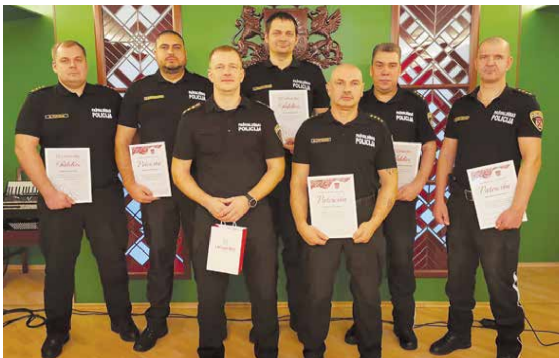
Lielvārdes novada pašvaldības policijas darbinieki.

“Par novada iekšējās drošības līmeni un līdz ar to arī pašvaldības policijas darbu ikviens iedzīvotājs, pirmkārt, spriež pēc personiskās saskarsmes ar policistiem. Tiem, kas apzināti pārkāpj likumu, nešaubīgi ir jāsaņem pelnītais sods. Bet tiem, kas vērstas pie policijas pēc palīdzības, ir jārod pārliecība,