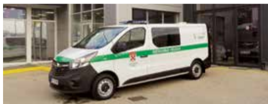
Lielvārdes novada pašvaldības jaunais operatīvais transportlīdzeklis.

Automašīnai tika veikta pārbūve un aprīkošana atbilstoši noteikumiem par operatīvajiem transportlīdzekļiem, ir izveidots aizturēto personu pārvadāšanas nodalījums (izolators) divām personām. Automašīna ir pielāgota policijas ikdienas darba pienākumu veikšanai ar iespēju attālināti pieslēgties un izmantot darbam nepieciešamās datu bāzes, kā arī automašīna aprīkota ar videonovērošanas kamerām. Jaunā automašīna tiks izmantota ikdienas darbam: patrulēšanai, braukšanai