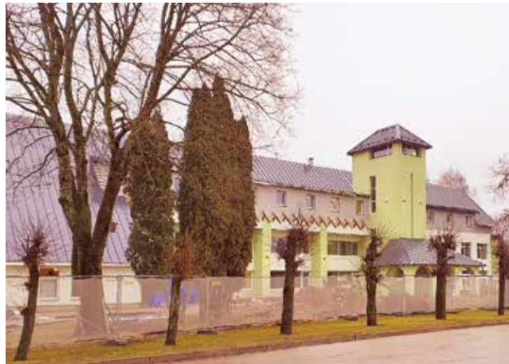
Jumpravas pagasta pārvaldes ēka.

Ir apstiprināts Lielvārdes novada pašvaldības projekta "Deinstucionalizācija un sociālie pakalpojumi Lielvārdes novadā" iesniegums, kas paredz sociālās rehabilitācijas pakalpojumu izveidi Lielvārdes novadā. 2020. gadā tiks uzsākta Rīgas plānošanas reģiona "Deinstucionalizācijas plānā 2017.-2020. gadam" noteiktās rehabilitācijas pakalpojumu infrastruktūras izveide bērniem ar funkcionāliem traucējumiem, specializēto darbnīcu pakalpojumu personām ar garīga rakstura traucējumiem izveide Lielvārdes novadā. Šo pakalpojumu infrastruktūras izveides kopējās izmaksas ir plānotas 302 797