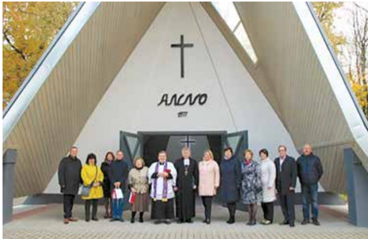
Atjaunotā Lāčplēša kapu kapliča.

Projekta ietvaros ir uzstādītas trīs pontonu tipa ūdens sportlīdzekļu pietauvošanās vietas – uz Lielās salas Daugavā, pie Dzejas ozoliem Kaibalā un uz Garās salas. Uz Lielās