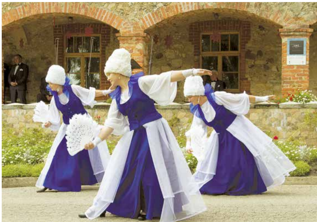
Jau piekto gadu pie Andreja Pumpura Lielvārdes muzeja norisinājās tradicionālie svētki "Lielvārdes pils aicina".

Un kā gan lai nestrādā pēc labākās sirdsapziņas, ja pēc padarīta darba bieži saņemam pateicības vārdus, sirsnīgas vēstules muzeja