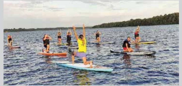
Supošana ir nodarbe, kas liek strādāt visām muskuļu grupām.