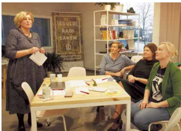
Semināra dalībnieki, prezentējot savu ideju.