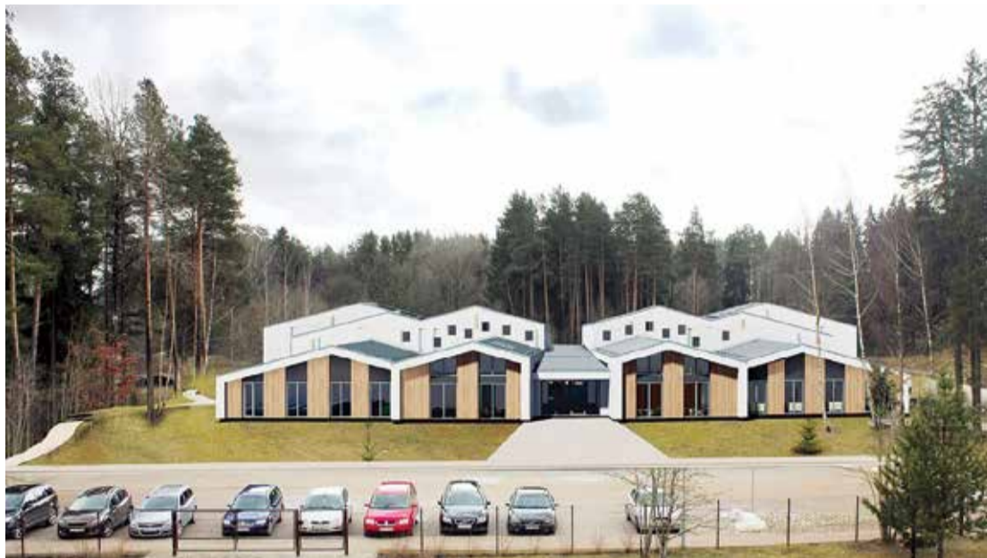
Jaunās pirmsskolas izglītības iestādes vizualizācija.

Šogad būtiski ieguldījumi veikti arī Lēdmanes ielu apgaismojuma infrastruktūrā – Lēdmanes pagasta centrā uzstādīti 62 ielu apgaismo-