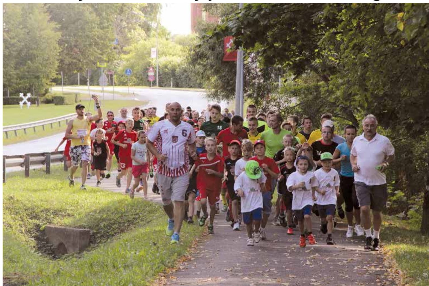
Paldies dalībniekiem par aktīvu līdzdarbošanos Lielvārdes novada sporta centra rīkotajā pasākumā. Ar kopīgu skrējienu tika ieskandināts jaunais mācību gads, veiksmīgu turpmāko distanci un labus rezultātus mācībās!