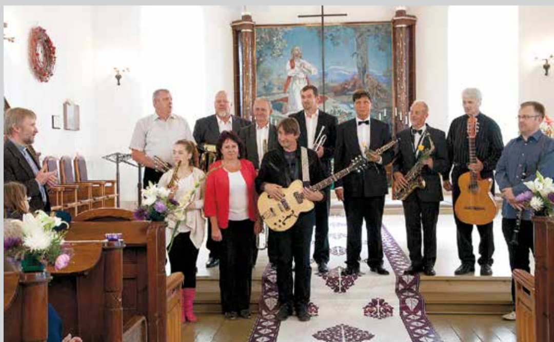
07.08. 015. Luterāņu baznīcā bija koncerts, kurā muzicēja visi šīs vasaras sestdienu vakaru mūziķi.