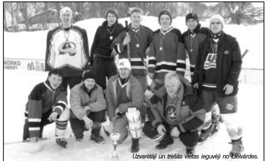
Uzvarētāji un trešās vietas ieguvēji no Lielvārdes.