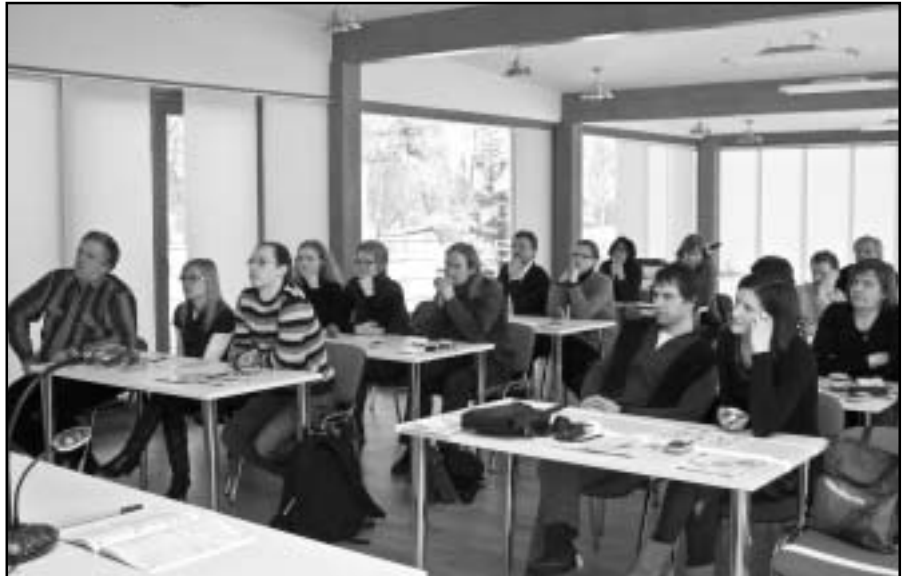
Seminārs notiek reģionālajā skolotāju tālākizglītības centrā „Lielvārdā” – rītdienas mācību telpā.