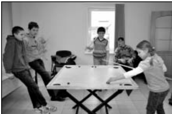
Dienas centrā novuss ir viena no populārākajām spēlēm.