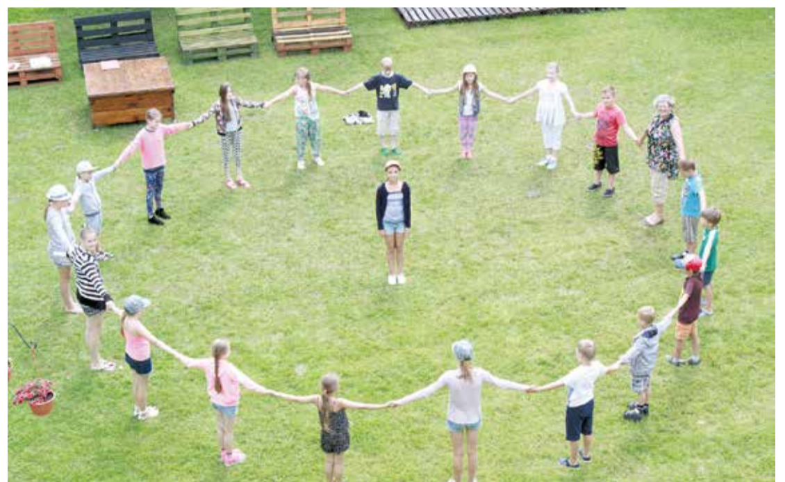
Nometnes “Tēvu tēvu laipas mestas” dalībnieki.

2016.gada vasarā jau sešpadsmito reizi norisinājās nometne “Upe” bērniem un jauniešiem,