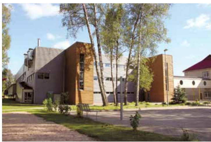
Lielvārdes novada sporta centrs.

Dienesta pārbaudē tika konstatēti vairāki trūkumi Lielvārdes novada sporta centra darbībā. Pēc dienesta pārbaudes pabeigšanas atkārtoti tika sasaukta domes ārkārtas sēde, lai lemtu par tālāko rīcību. Pēc diskusijām deputāti nobal-