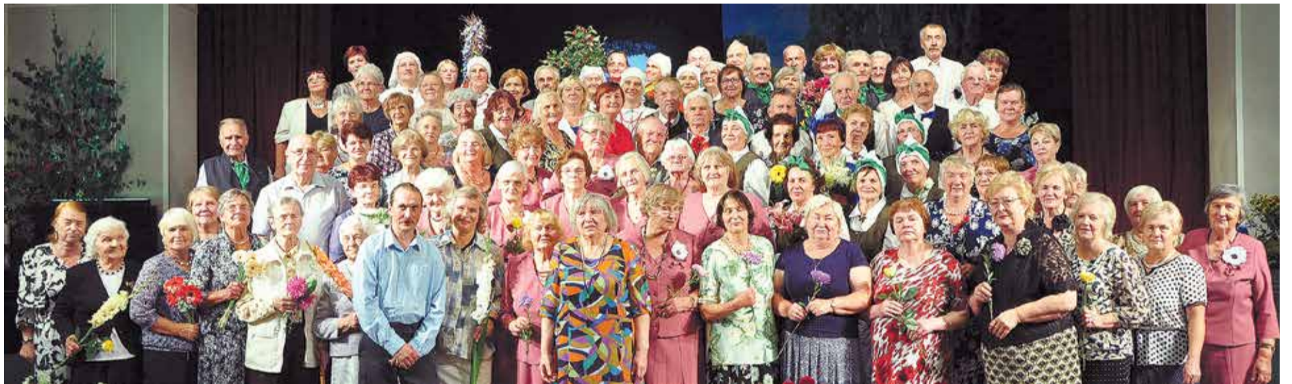
Pensionāru biedrības biedri un viesi vienojušies kopīgā foto.