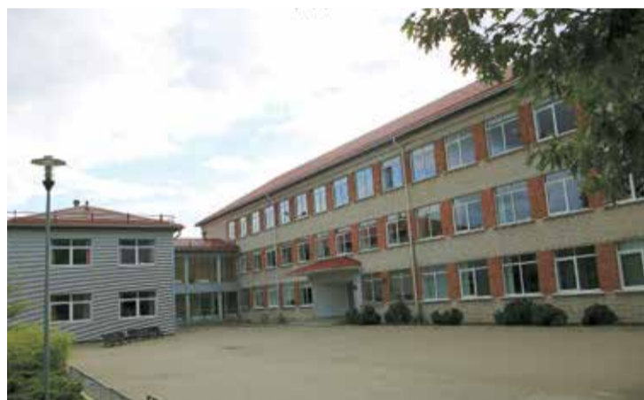
Edgara Kauliņa Lielvārdes vidusskola sava 71. mācību gada priekšvakarā.

Otra laureāte (no man zināmajām) ir mana 20. izlaiduma klase