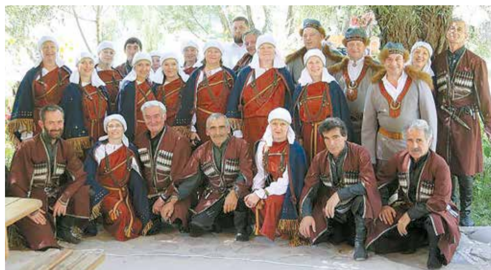
Koris „Lāčplēsis” Gruzijā.