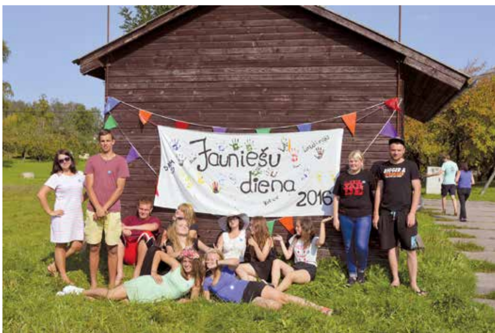
Lielvārdes novada jaunieši paši prot sev sarīkot svētkus!